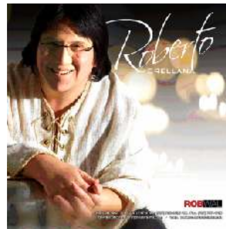
Tema 1 Un Milagro Balada