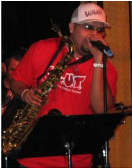
Tema 13 Como se te ocurre Salsa