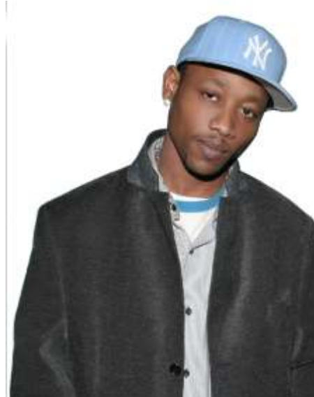
Tema 6 Déjame Decirte Reggaeton

Viene en camino el álbum completo que se lanzará internacionalmente lleno de energía y producido por REY productions con el apoyo de LR entertainment, empresas de jóvenes profesionales que están marcando diferencia en el ámbito del show business en Canadá.