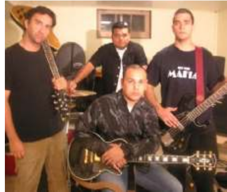
Tema 14 Hijo del Arbol Rock Sudamericano