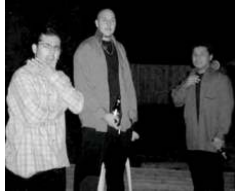
Tema 16 Familia Destrozada Hip - hop

PRODUCTOS SUDAMERICANOS ----- - HOT TABLE ----- Pastas Caseras - Sandwiches de Miga - Empanadas - Tortas para toda Ocasión Servicio de Lunch - Comida para llevar - Pollo al Espiedo - Salón de Fiestas