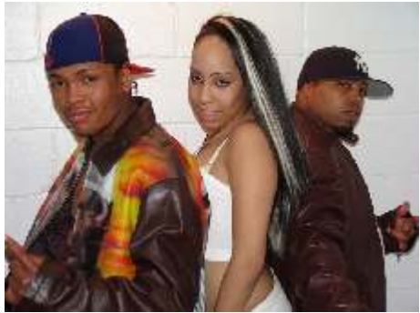
Tema 5 Tuve un Amor Reggaeton